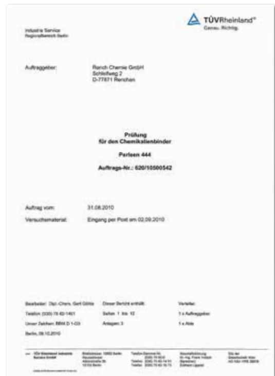
TÜV-Prüfung zur chemischen Verträglichkeit

Entsorgung: Kontaminiertes Material ist Sondermüll. Sauberes Korn wiederverwenden oder zur Bodenverbesserung (hohe Wasserspeicherkraft) der Natur zurückgeben.